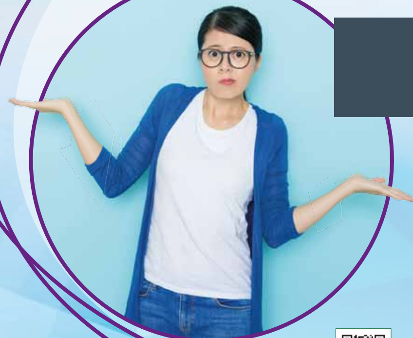
Der QR-Code führt direkt zum Entscheidungsnavi